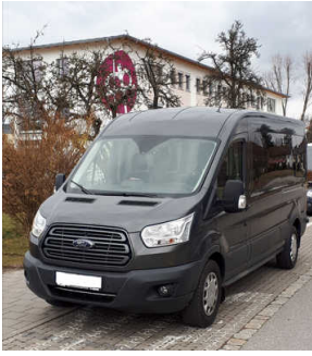
Rollstuhlfahrzeug mit Linearlift