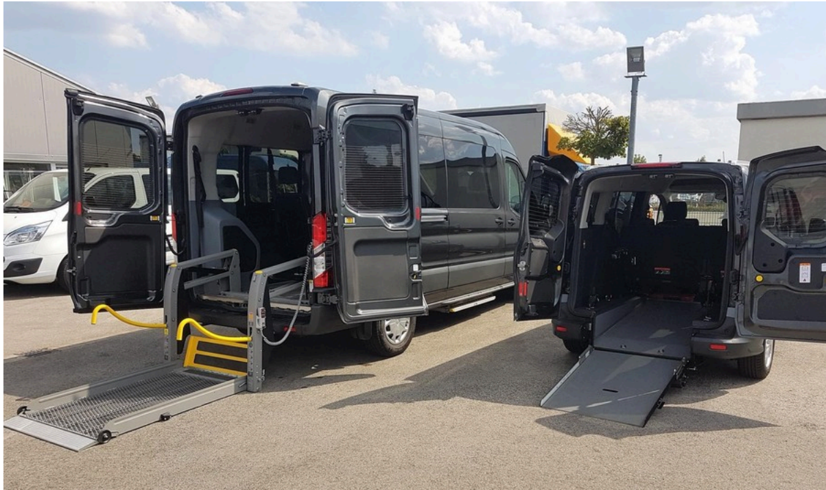
Fahrzeug mit Linearlift und Rampe