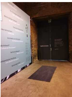
Interimsausstellung Nürnberg – Ort der Reichsparteitage – Inszenierung, Erlebnis und Gewalt