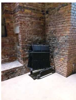
Alarm/Hilfsmittel – Erstgespräch