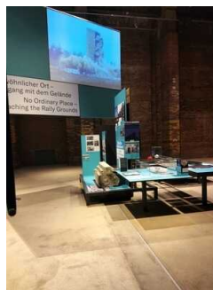
Interimsausstellung Nürnberg – Ort der Reichsparteitage – Inszenierung, Erlebnis und Gewalt