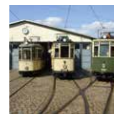
Historisches Straßenbahndepot St. Peter

Die aus dem 14. Jahrhundert stammende Peterskapelle wurde zu klein, weshalb gegenüber Anfang des 20. Jahrhunderts die neugotische Peterskirche errichtet wurde.