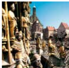
Hauptmarkt mit Schönerm Brunnen

Während des Zweiten Weltkriegs wurde die 1230 erbaute St. Sebald-Kirche weitgehend zerstört, in den folgenden Jahren aber aufwendig wiederhergestellt. Im Inneren der Kirche sticht das Grab des St. Sebaldus hervor, dem Schutzheiligen Nürnbergs. Den Bronzeguss fertigten Peter Vischer und seine Söhne von 1508 bis 1509 an.