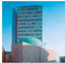
Hochhaus am Plärrer und Planetarium

Hier war 1835 der Startpunkt des „Adler“, der ersten deutschen Eisenbahn, die zwischen Nürnberg und Fürth fuhr. Am westlichen Rand befindet sich das unter Denkmalschutz stehende „Plärrer-Hochhaus“ – erbaut 1953, mit 56 Metern damals das höchste Gebäude Bayerns.