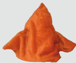
Das Magische Museumskissen „MaMuKi“ wohnt im Tuscherschloss