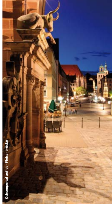
Oxenportal auf der Fleischbrücke