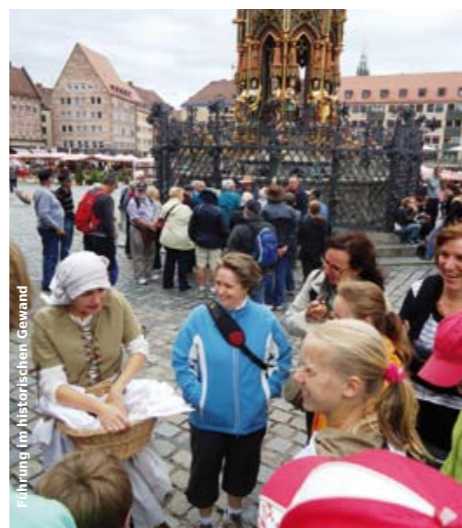
Führung im historischen Gewand