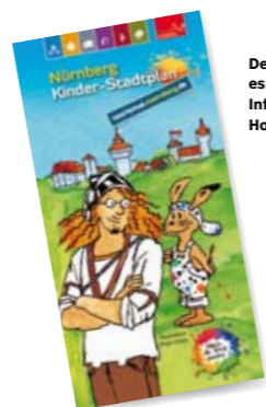
Den Kinderstadtplan gibt es kostenlos in den Tourist Informationen und in vielen Hotels.