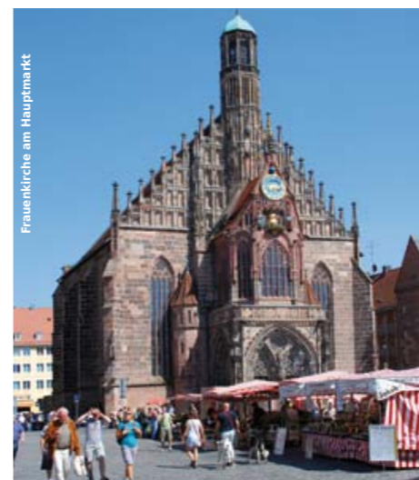
Frauenkirche am Hauptmarkt