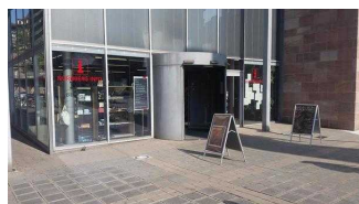
Eingangsbereich Tourist Information in der Nürnberg INFO