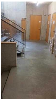
Weg zum WC