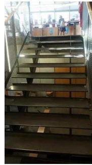
Treppe zum UG