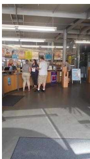
Weg zum Tresen