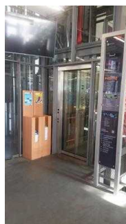
Weg zum Aufzug