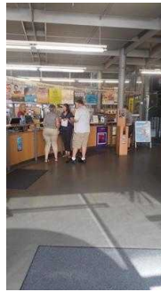
Blick auf den Tresen vom Eingang aus