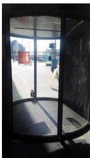
Eingang von innen