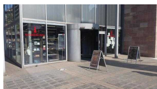
Eingangsbereich Tourist Information in der Nürnberg INFO