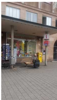
Eingangsbereich Tourist Information am Hauptmarkt