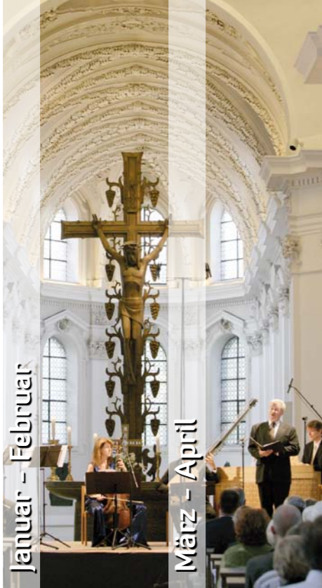
Januar - Februar