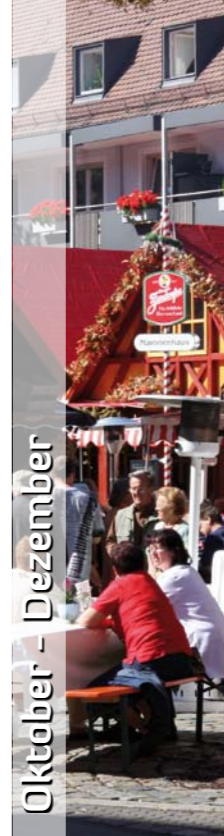
Oktober - Dezember

| 22. September 11. Opernball Albrecht Dürer Staatstheater Nürnberg Opernhaus operball-albrecht-duerer.de