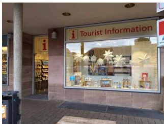
Tourist Information Nürnberg am Hauptmarkt