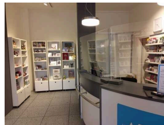
Tourist Information Nürnberg am Hauptmarkt