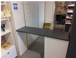
Bild von erniedrigtem Counterbereich für Kommunikation mit Rollstuhlfahrern