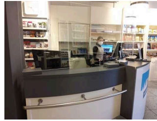
Bild von Counter/ Verkaufstresen