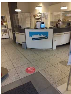
Tourist Information Nürnberg am Hauptmarkt