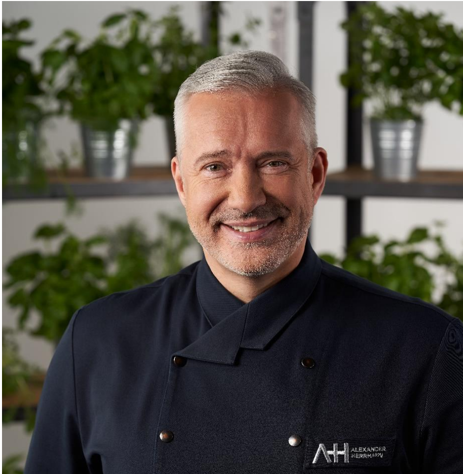
Alexander Herrmann Spitzenkoch und Unternehmer